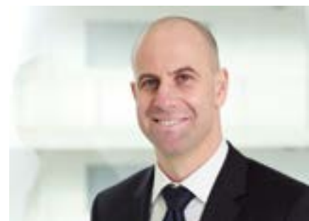
Dr. Reto Flury, Directeur EGK

À la fin 2019, le portefeuille clients d'EGK comptait 82 641 assurés dans l'assurance de base et 82 192 assurés dans l'assurance complémentaire. Les provisions actuarielles consolidées ont été relevées à CHF 268 millions, ce qui confère une sécurité supplémentaire aux assurés en cette période éprouvante pour le système de santé. L'exercice globalement positif entraîne un renforcement de l'ensemble du groupe EGK: les fonds propres ont augmenté de 16.8%, franchissant ainsi la barre des CHF 200 millions.